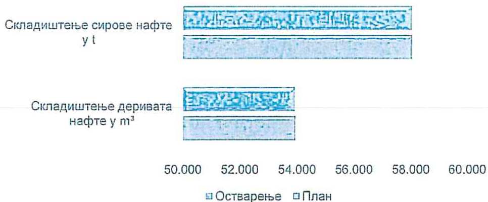
График 3. Упоредни приказ планираних и складиштених количина сирове нафте и деривата нафте за прва три месеца 2022. године