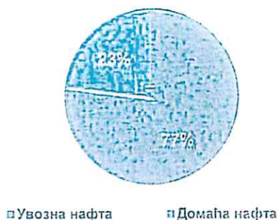
График 2. Структура оствареног обима транспорта по пореклу нафте за прва три месеца 2022. године

Транспортоване количине сирове нафте по месецима и деоницама у односу на планиране, приказане су у табели 3.