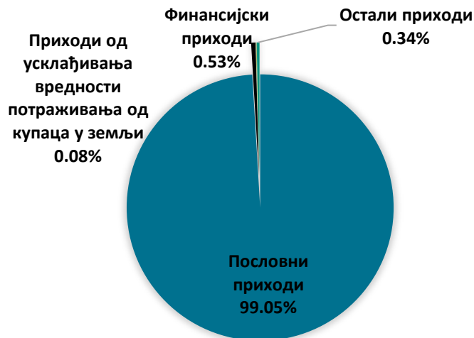
График 5 Структура планираних укупних прихода по ребалансу плана 2 за 2020. годину